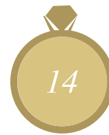
La talla es exacta