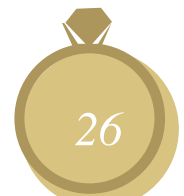
La talla no es correcta