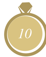
La talla no es correcta

En este ejemplo su anillo se correspondería con la talla 14.